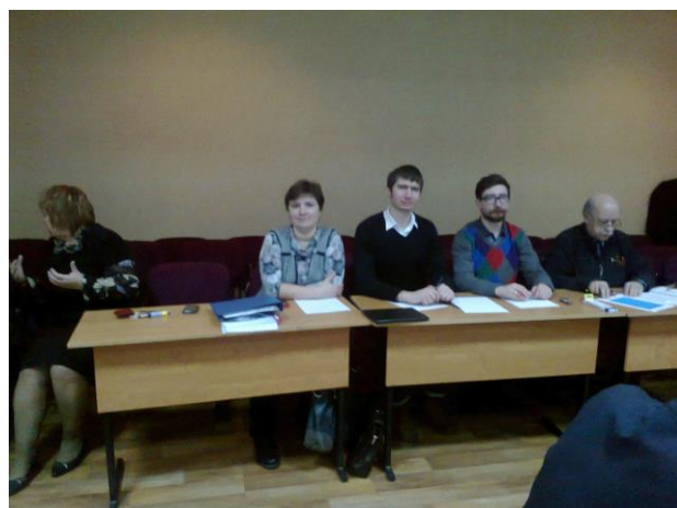
( Жюри конкурса)