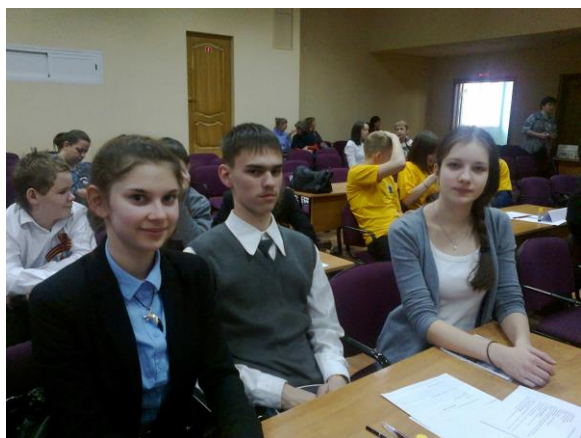
(Перед началом конкурса)

Вторая часть - это конкурс активистов музеев, в котором принимали участие команды школ, состоящие из 3-х человек.