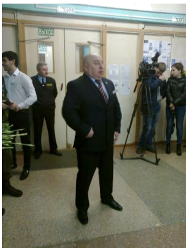
Выступление руководителя Региональной общественной организации ветеранов боевых действий