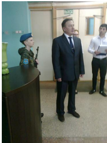
Выступление директора школы