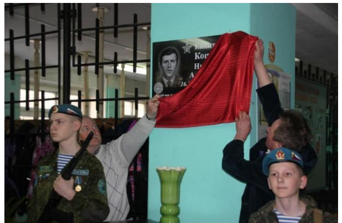
Открытие мемориальной доски