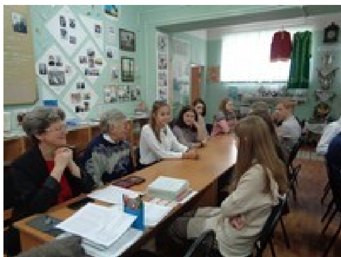
В музее школы перед началом встречи