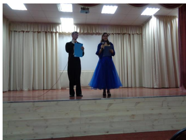
Торжественное закрытие конференции