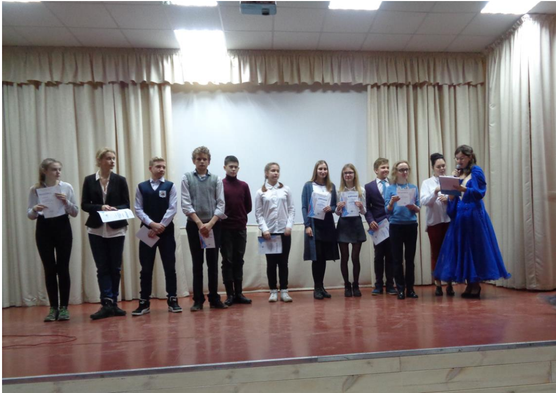
На сцене победители секций — участники конференции.