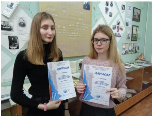
Фото на память в музее школы