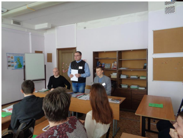
Комиссия конкурса секции «Военная история», где выступали наши учащиеся