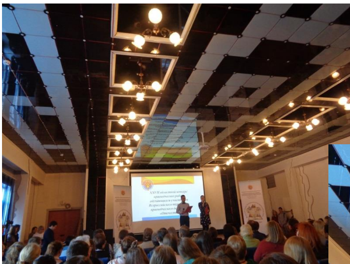
Открытие областного конкурса 23.01.2010.