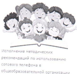
Рисунок 1 – баннер «Исполнение методических рекомендаций по использованию сотового телефона в общеобразовательной организации»

Для авторизации необходимо воспользоваться ссылкой http://test2.ozdorovlenie-nii.ru:8080 или зайти на официальный сайт Роспотребнадзора, Рособрнадзора, Минпросвещения России и через баннер «Исполнение методических рекомендаций по использованию сотовых телефонов в общеобразовательной организации» (рисунок 1) перейти в программу нажатием на пункт «Ссылка для входа и прохождения анкетирования в программном средстве» (рисунок 2).